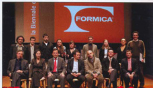
El jurado junto a los participantes en el evento

Las autoras del proyecto definieron "METAFORMICA" como "un contenedor de ideas, una célula que voltea