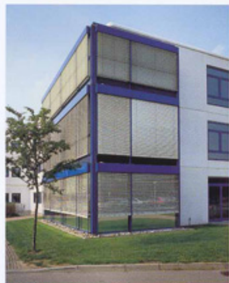
→ MAXIMATIC > Material utilizado: lama de aluminio.